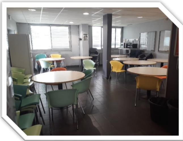
Salle des étudiants